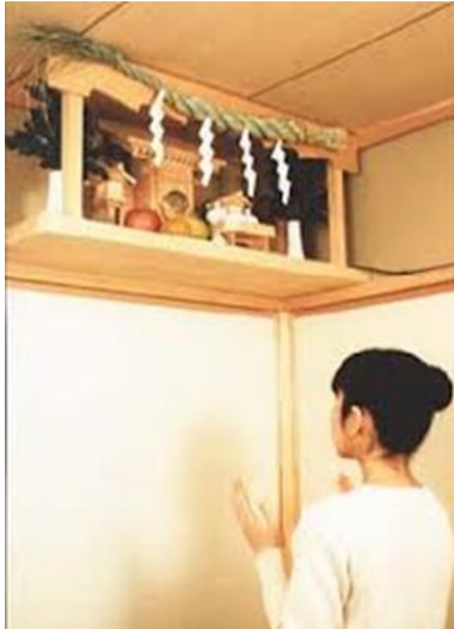
Figura 3: Kamidana

Para fins de ilustração e entendimento a respeito das diferenças comentadas, entre o Butsudan e o Kamidana utilizou-se, novamente, imagens de domínio público. Pode-se perceber que o Kamidana , ocupa um espaço de maior destaque dentro da casa, e sempre na parte superior da parede.