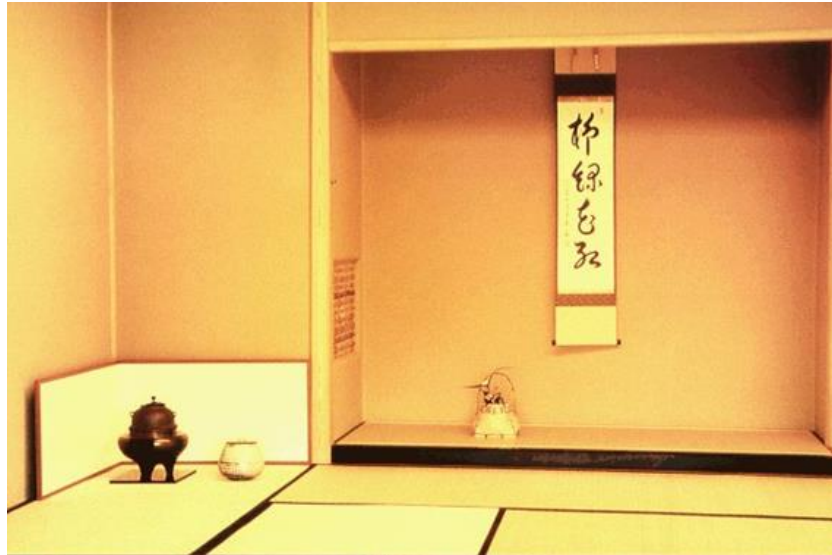
Figura 1: Tokonoma.

lembrado pelos japoneses, não foi observado nas residências visitadas. Para demonstrar as características de um tokonoma , utilizou-se uma imagem, de domínio público, retirada da internet, que é apenas representativa 9 .