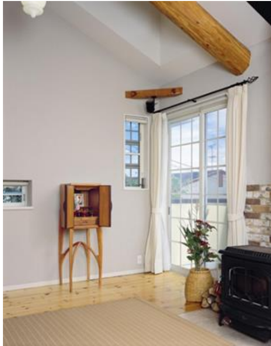
Figura 5: Butsudan.

como fora visualizado em algumas residências e alguns ornamentos comuns às famílias que visitadas.