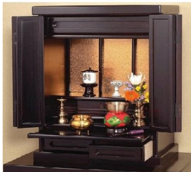
Figura 2: Butsudan.