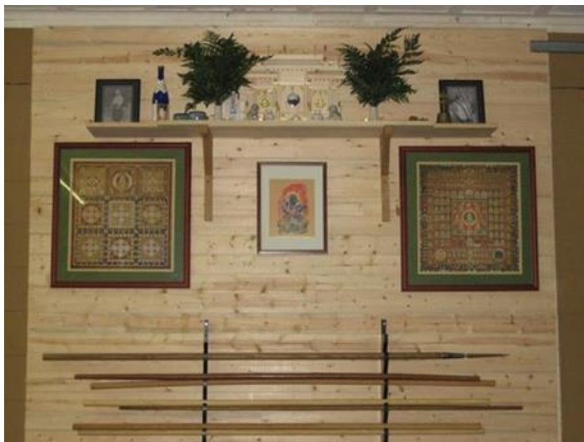
Figura 4: Kamidana .