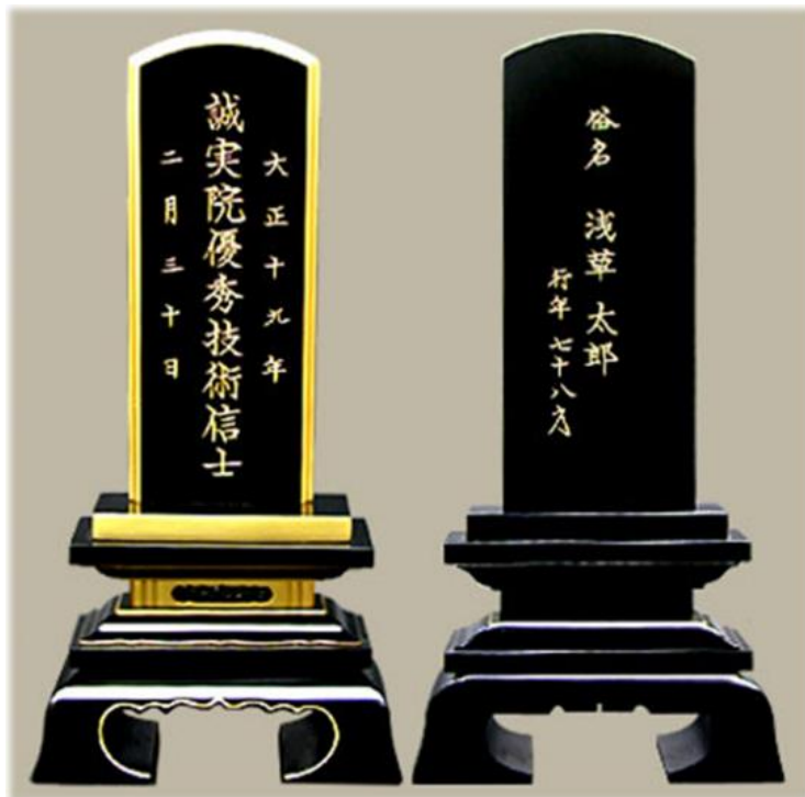
Figura 7: Ihai .

É, todo mundo tem a ‘casinha’ onde a gente tem o ihai , que dizem tem que se colocar em uma folha de madeira fininha sabe, daí a gente coloca o nome da pessoa falecida, a data que faleceu, quantos anos tinha, cada um é diferente, eu já não sou muito de rezar, um monte de coisas assim, sempre de manhã eu peço para proteger nós, sabe, nossa família, paz [...]